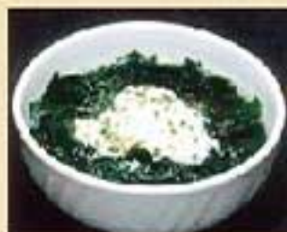
ワカメクッパ ¥720 ミニワカメクッパ ¥600 ワカメと玉子入りの雑炊