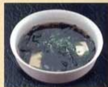
ワカメスープ ¥500 ハーフサイズ ¥370