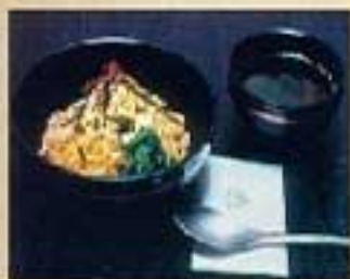
ビビンバ ¥770 ミニビビンバ ¥620