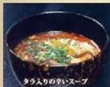
テグタンクッパ ¥990 ミニ ¥800 テグタンうどん ¥1,080 ミニ ¥900 テグタン麺 ¥1,080 ミニ ¥900