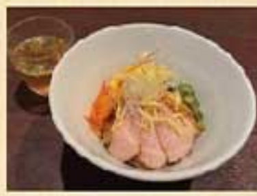
ビビン麺 ¥1,150 ミニビビン麺 ¥970