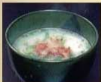
コムタンスープ ¥990 ハーフサイズ ¥790 チール肉を煮込んだスープ