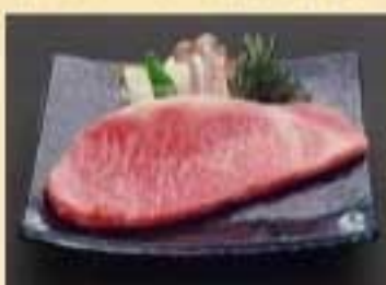
サーロイン焼き ¥5,810 厳選された上質なサーロイン