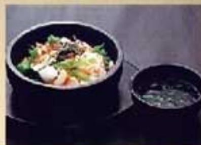
シーフード石焼ビビンバ ¥1,760 ミニ ¥1,450