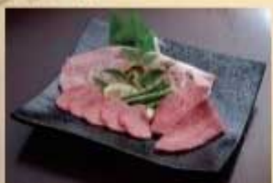
特上盛り合せ ¥11,000 サーロイン・ミスジ・特上タン塩