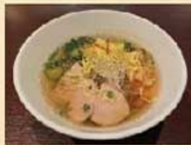
冷麺 ¥1,100 ミニ冷麺 ¥920

こしのある麺をさっぱりした冷たいスープで 極太麺・中細麺・盛岡冷麺 いずれかをお選びください