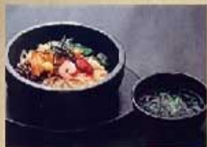
石焼ビビンバ ¥1,430 ミニ石焼ビビンバ ¥1,100

アツアツの出来立てをどうぞ 石鍋でそのまま焼き上げますので少々お時間がかかります