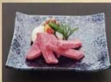
リブローズ芯 ¥3,410 ジューシーなリブの芯を厚切りで