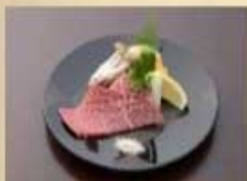
特選塩ロース ¥2,640 やわらかく、すっきりとした旨味