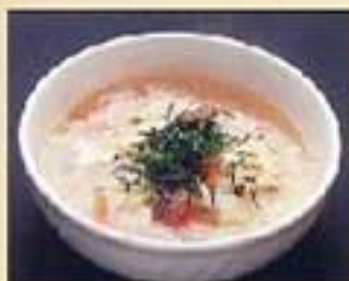
クッパ ¥720 ミニクッパ ¥600 肉と野菜入りの優しいスープの雑炊