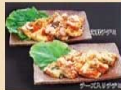
海鮮チヂミ ¥1,100 チーズ入りチヂミ ¥990