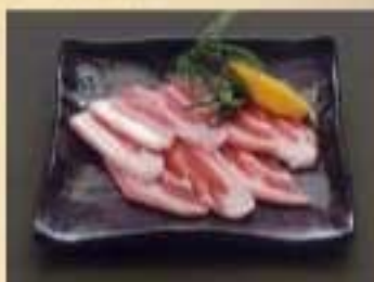
黒豚 ¥900 ウィンナー ¥550