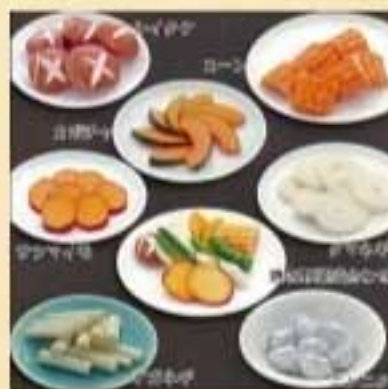
焼き野菜盛り合せ ¥660 シイタケ ¥610 サツマイモ ¥610 カボチャ ¥610 ナガネギ ¥610 タマネギ ¥610 コーン ¥610 ニンニク ¥520