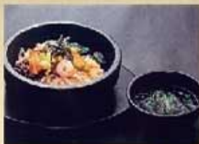
チーズ石焼ビビンバ ¥1,600 ミニ ¥1,250