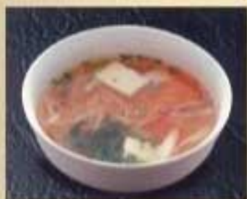
野菜スープ ¥500 ハーフサイズ ¥370