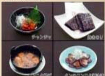
チャンジャ ¥580 焼きのり ¥580 ニンニク揚げ ¥840 ニンニクを胡麻油で揚げたパワフルな味 牛タンのニンニク醤油漬け ¥880