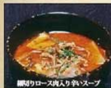
ユッケジャンクッパ ¥990 ミニ ¥800 ユッケジャンうどん ¥1,080 ミニ ¥900 ユッケジャン麺 ¥1,080 ミニ ¥900