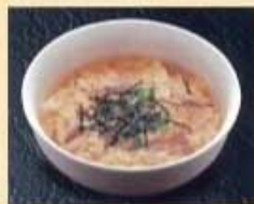
玉子スープ ¥500 ハーフサイズ ¥370