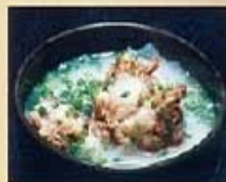
コムタンクッパ ¥1,210 ミニコムタンクッパ ¥1,000 テール肉を煮込んだ白いスープの雑炊