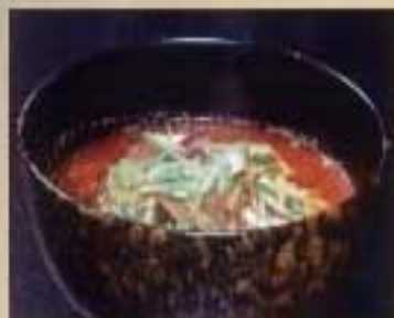
キュウケジャンスープ ¥880 ハーフサイズ ¥680 細切りロース肉入りの辛いスープ