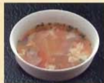
軍鶏(シャモ)スープ ¥570 ハーフサイズ ¥430 コクのある地鍋のヒナ肉スープ