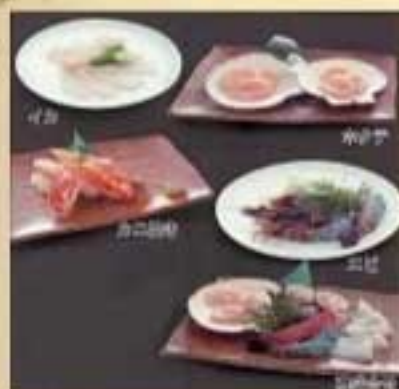
磯盛り合せ ¥2,420 エビ・カニ・ホタテ・イカ カニ焼き ¥2,420 ホタテ焼き ¥1,320 イカ焼き ¥770 エビ焼き ¥1,100 有頭エビを2尾