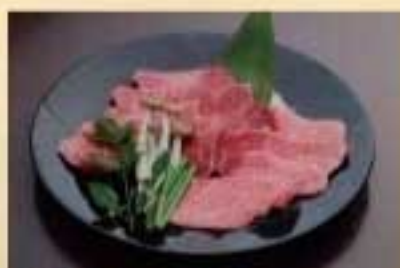
上盛り合せ ¥6,490 上カルビ・上ロース・和牛ハラミ