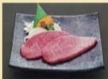
みすじ焼き ¥3,080 緩かなサシの入った濃厚な赤身肉