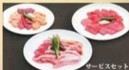
サービスセット サービスセット ¥5,170 (2~3名様でどうぞ) ファミリーセット ¥7,850 (4~5名様でどうぞ) タン塩・軍鶏・トントロ・黒豚・カルビ ロース・レバー・ハツ・ギアラ・ホルモン