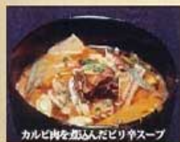
カルビクッパ ¥990 ミニ ¥800 カルビうどん ¥1,080 ミニ ¥900 カルビ麺 ¥1,080 ミニ ¥900

こしのある麺をさっぱりした冷たいスープで 極太麺・中細麺・盛岡冷麺 いずれかをお選びください