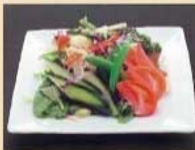
コンビネーションサラダ ¥790