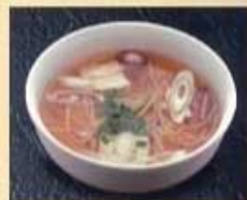
もやしスープ ¥500 ハーフサイズ ¥370