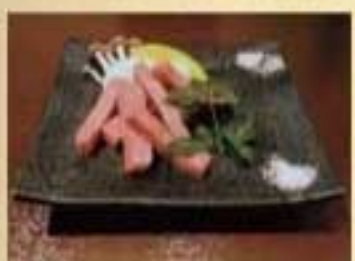
ザブトンの角切り ¥3,410 こくのある味わいの霜降り肉