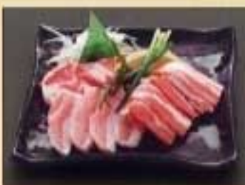
豚肉3種盛り ¥1,430 トントロ・イベリコ豚・黒豚