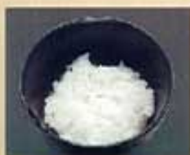
ライス ¥340 大盛り ¥400 少なめ ¥290