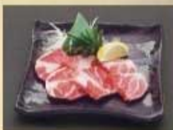
イベリコ豚 ¥1,090 どんぐり飼育豚